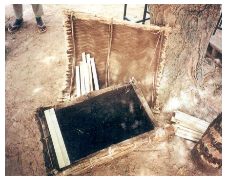
Ruche de type semi moderne Kenyane fabriquée avec de la paille

Une prochaine visite est prévue pour janvier 2006.