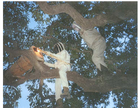
Cueillette du miel dans une ruche traditionnelle

En septembre 2005, l'association « Pilimpikou » a mis à ma disposition une 2 CV qui a été fort utile pour aller dans la brousse et l'association APIFLORDEV a financé 2 ruches, 3 combinaisons, 1 enfumoir, 1 lève cadres, bottes et gants, pour développer un programme apicole à Pilimpikou (qui se trouve à 100 km au nord de la capitale). Ces 2 ruches ont été posées à des endroits judicieux par les villageois et il n'a fallu que 2 jours pour que les abeilles s'invitent dans leurs nouvelles demeures.