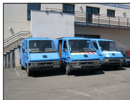
Véhicules donnés par EDF