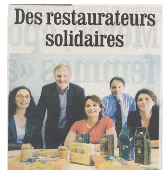
La Dépêche, le 27/04/05