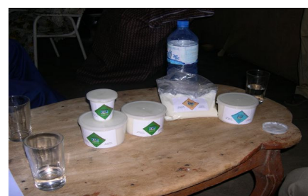
Produits de la coopérative