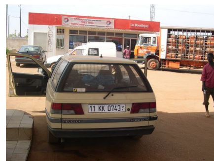
La 405 au Burkina Faso