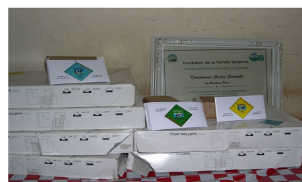
Étiquettes imprimées par ICA Concept à Agen et amenées au Burkina Faso pour la coopérative