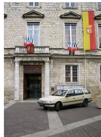
La Peugeot 405 devant la Mairie d'Agen